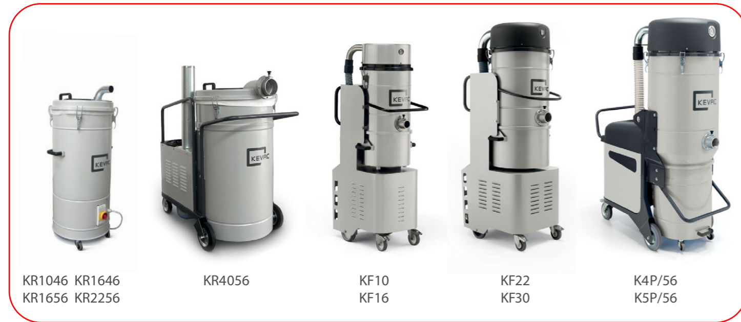
KR1046 KR1646 KR1656 KR2256